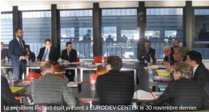
Le président Richert était présent à EURODEV CENTER le 30 novembre dernier.