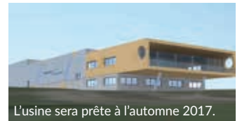
L'usine sera prête à l'automne 2017.

« Nous allons étoffer notre parc de ventilateurs et machines à la location. » Une entreprise qui ne cesse d'innover dans ce domaine si particulier de la qualité de l'air. « Nous sommes les seuls à avoir créé des cabines de survie pour les souterrains. En clair, ce sont des espaces qui résistent à différentes contraintes et permettent aux ouvriers, en cas de sinistre sur un chantier, de s'y réfugier. » Avec ce futur bâtiment, qui devrait ouvrir ses portes à l'automne 2017, Partnair Industries va ainsi pouvoir doubler ses effectifs sur 36 mois. « Nous lançons une campagne d'embauches d'une quinzaine de personnes dans divers domaines : des commerciaux pour la France, mais aussi l'export, des ouvriers de production... Notre objectif est de former une équipe d'une trentaine de salariés à l'horizon 2020. » L'année 2017 s'annonce donc chargée pour la jeune entreprise.