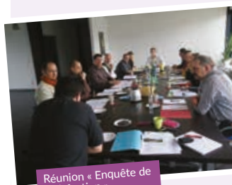
Réunion « Enquête de satisfaction ».

La Pépinière, c'est aussi un lieu de vie et d'échanges pour les jeunes chefs d'entreprise. À ce titre, des rencontres en interne sont régulièrement organisées. Des intervenants extérieurs viennent présenter leur savoir-faire. Chaque résident peut ensuite leur demander des conseils.