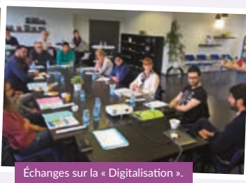
Échanges sur la « Digitalisation ».

Au-delà des manifestations professionnelles liées au développement économique, EURODEV CENTER organise régulièrement des animations conviviales destinées à stimuler les rencontres mais aussi l'échange d'expériences et de bonnes pratiques entre les entreprises / structures hébergées.