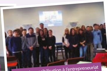
Cours de sensibilisation à l'entrepreneuriat régulièrement suivi par les étudiants de l'IUT Moselle-Est.