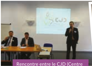
Rencontre entre le CJD (Centre des jeunes dirigeants) et les Wirtschaftsjunioren.

EURODEV CENTER est ainsi partenaire de l'IUT Moselle-Est et du Pôle entrepreneuriat étudiant de Lorraine, afin que les étudiants ayant l'envie d'entreprendre puissent échanger librement avec des professionnels de l'accompagnement. La Pépinière profite également de toute occasion pour donner envie aux jeunes d'entreprendre tout en encourageant ceux qui se sont déjà lancés :