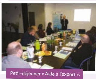
Petit-déjeuner « Aide à l'export ».