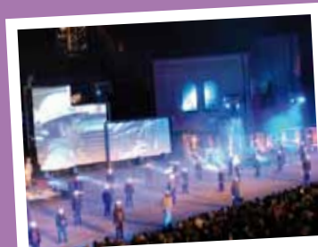
Spectacle son et lumières