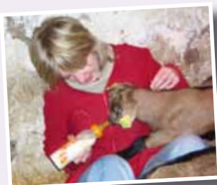
Chèvrerie de l'Est

Découvrez, tous les talents de nos artisans, leur savoir-faire, leur art et leur tradition.