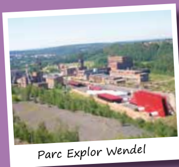
Parc Explor Wendel

Profitez de ce séjour en chambre d'hôtes pour découvrir cette région, berceau de l'Europe et l'histoire des gueules noires !